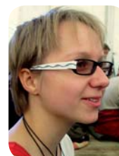
Hana Dovinová grafika a sazba